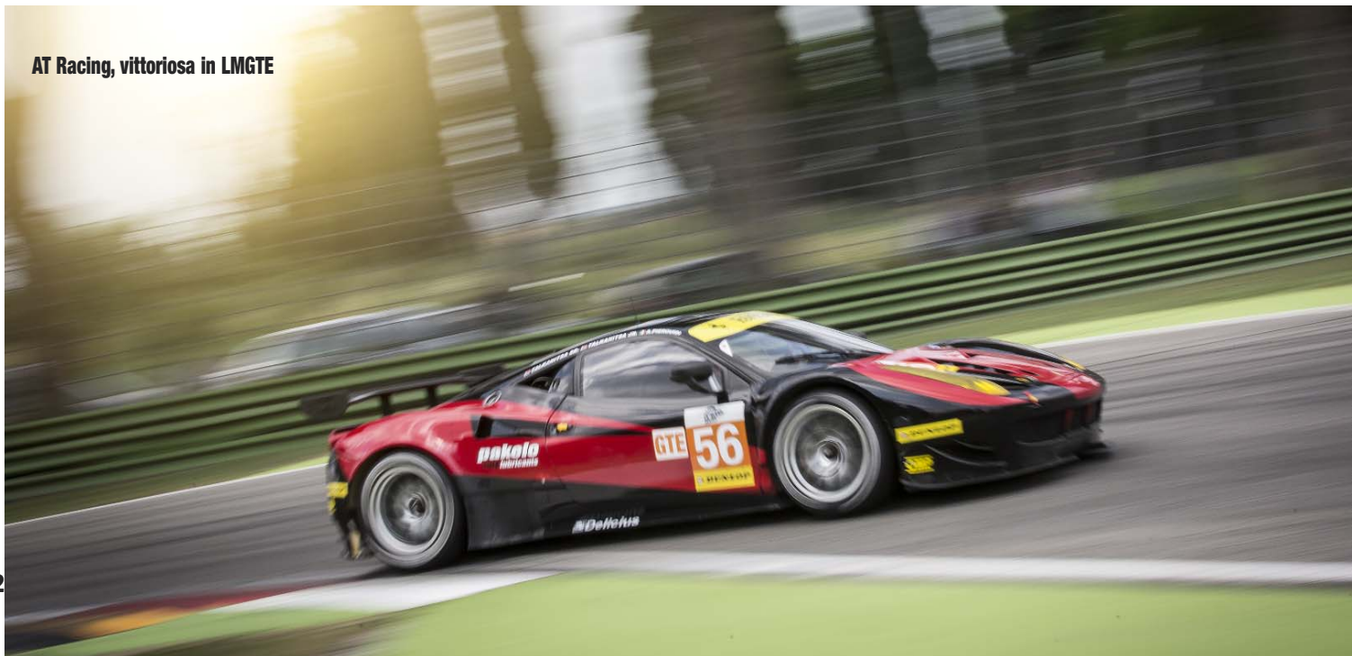
AT Racing, vittoriosa in LMGT2