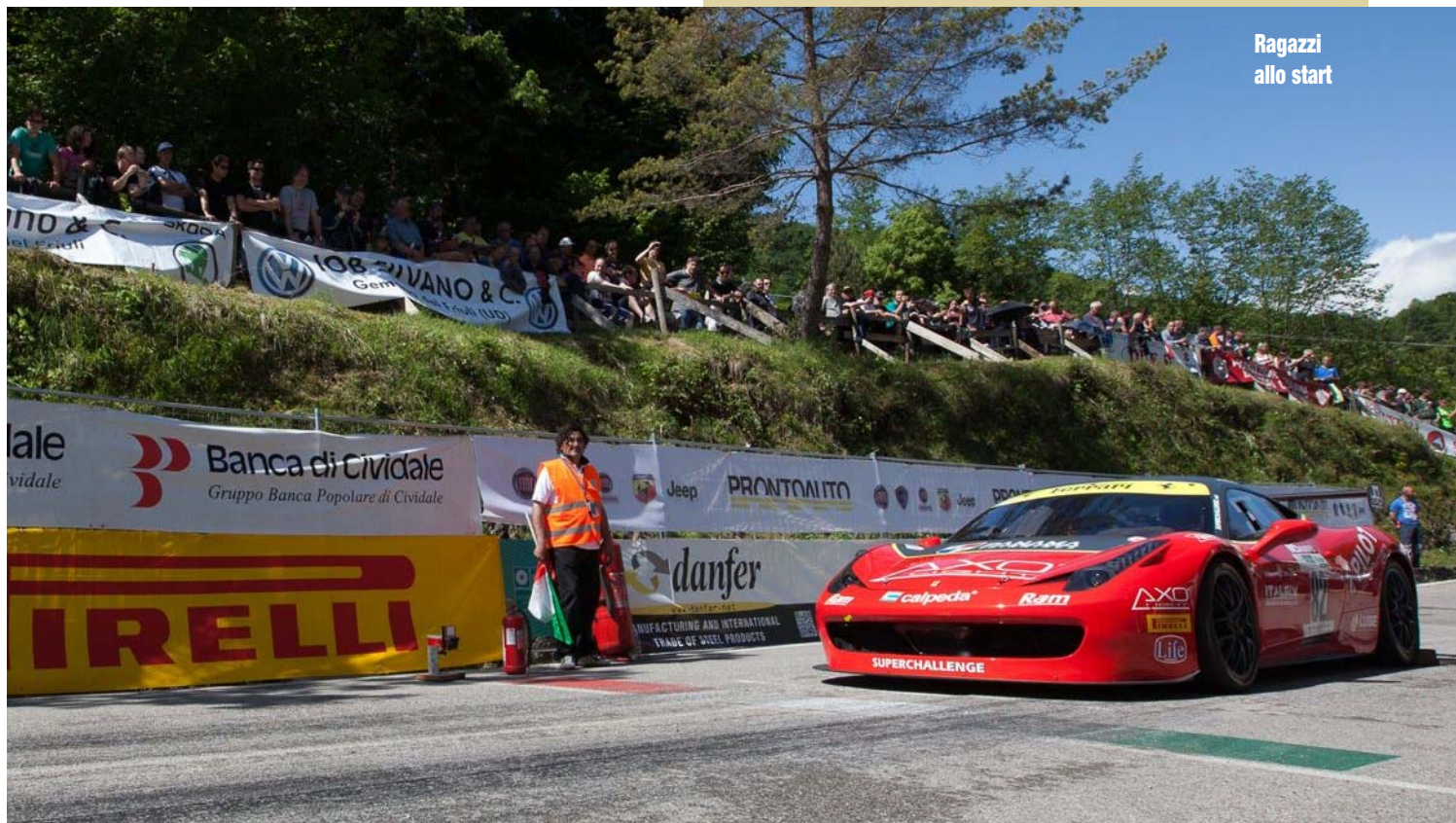
Ragazzi allo start