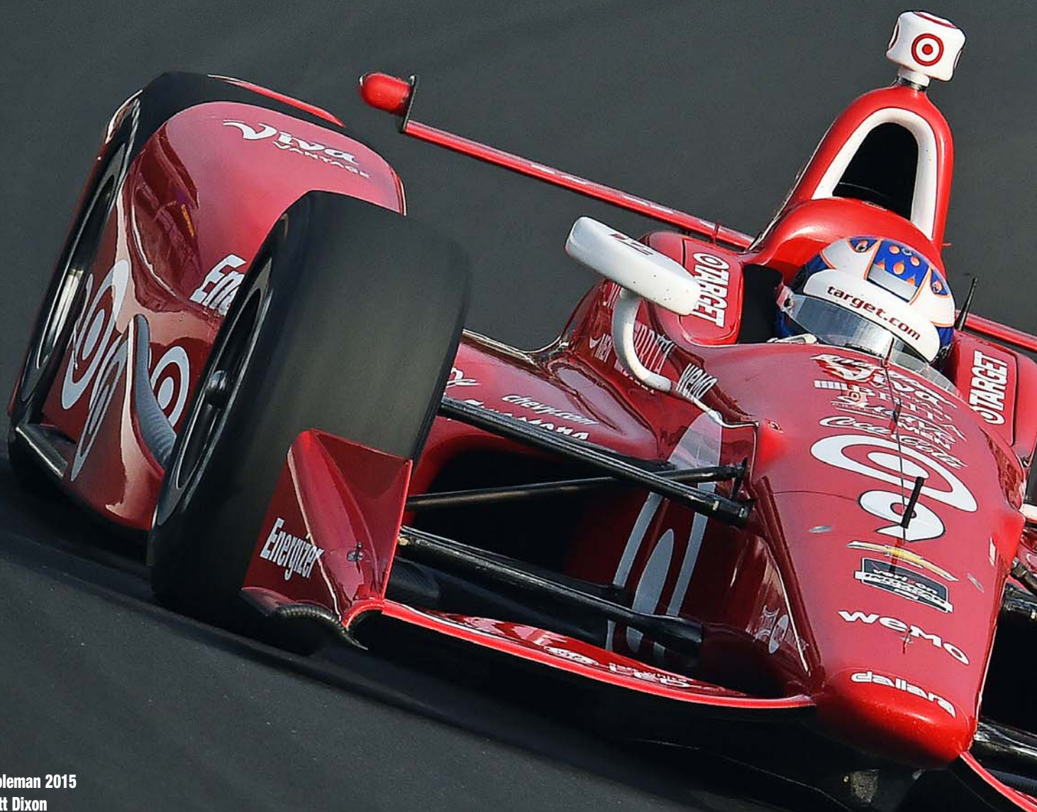
Il poleman 2015 Scott Dixon

La novantanovesima edizione della 500 Miglia si presenta ai nastri di partenza come una delle più competitive e multifaccettate dell'era moderna. Le vetture, tornate ad essere differenti sia dal punto estetico che da quello prestazionale, accentueranno la sfida tra top-team e "piccoli" in cerca di gloria