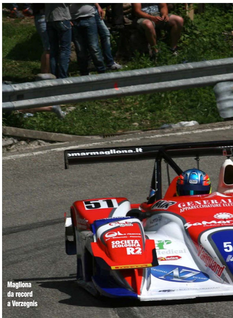
Magliona da record a Verzegnis