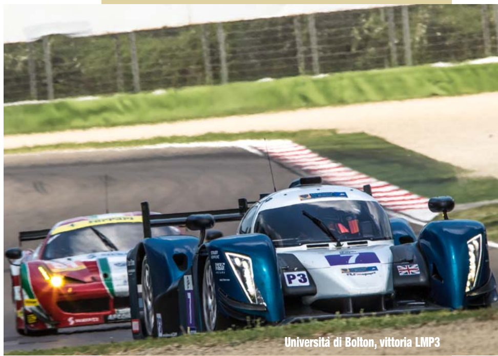
Università di Bolton, vittoria LMP3