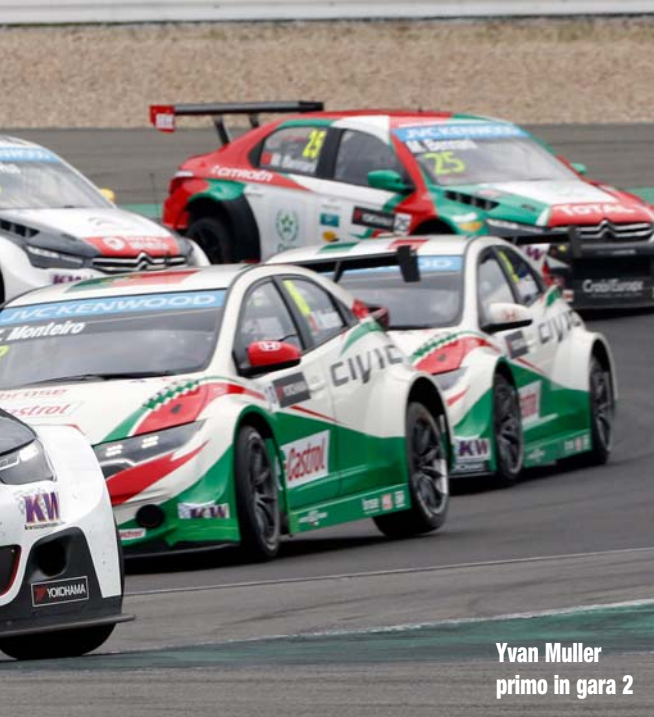
Yvan Muller primo in gara 2