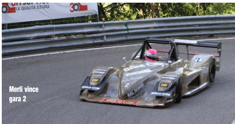
Merli vince gara 2