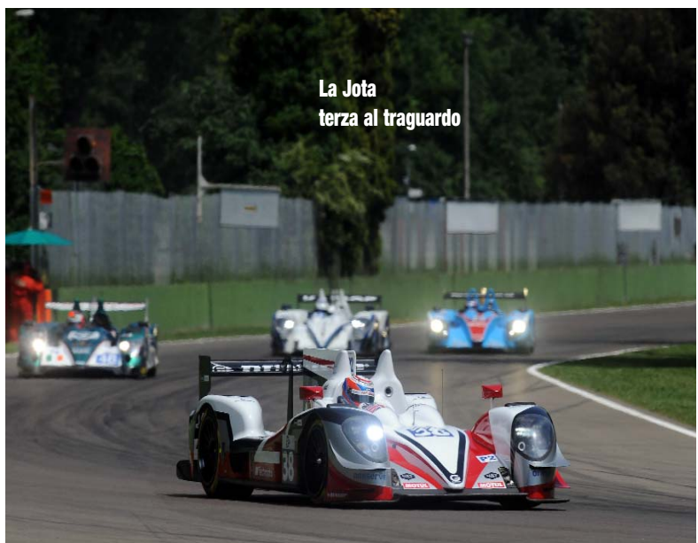
La Jota terza al traguardo