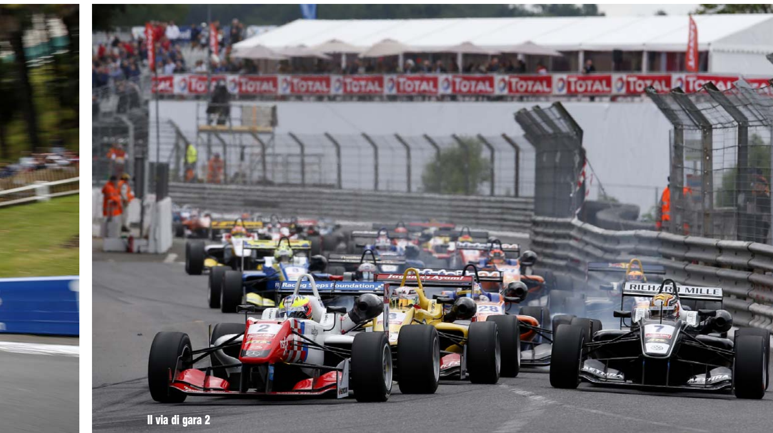
Il via di gara 2

6 podi – 4 vittorie, 1 secondo e 1 terzo posto Da Brands Hatch 1 a Nurburgring 3