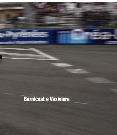
Barnicoat e Vaxiviere