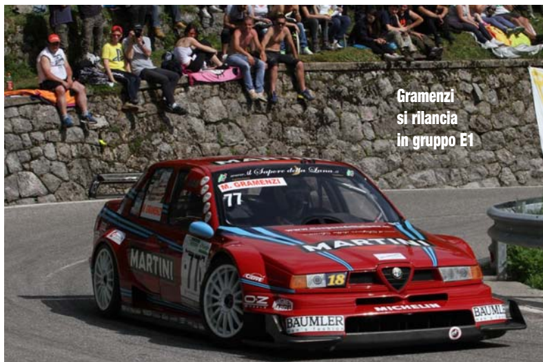
Gramenzi si rilancia in gruppo E1