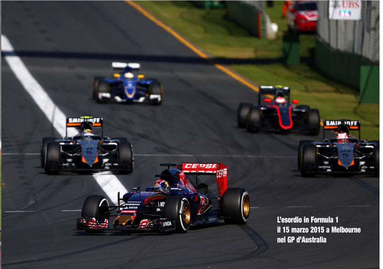
L'esordio in Formula 1 il 15 marzo 2015 a Melbourne nel GP d'Australia