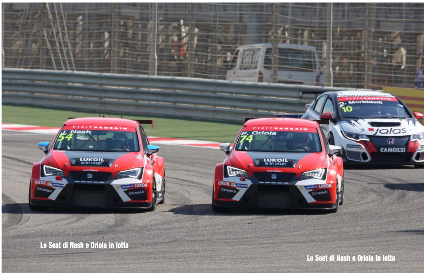
Le Seat di Nash e Oriola in lotta