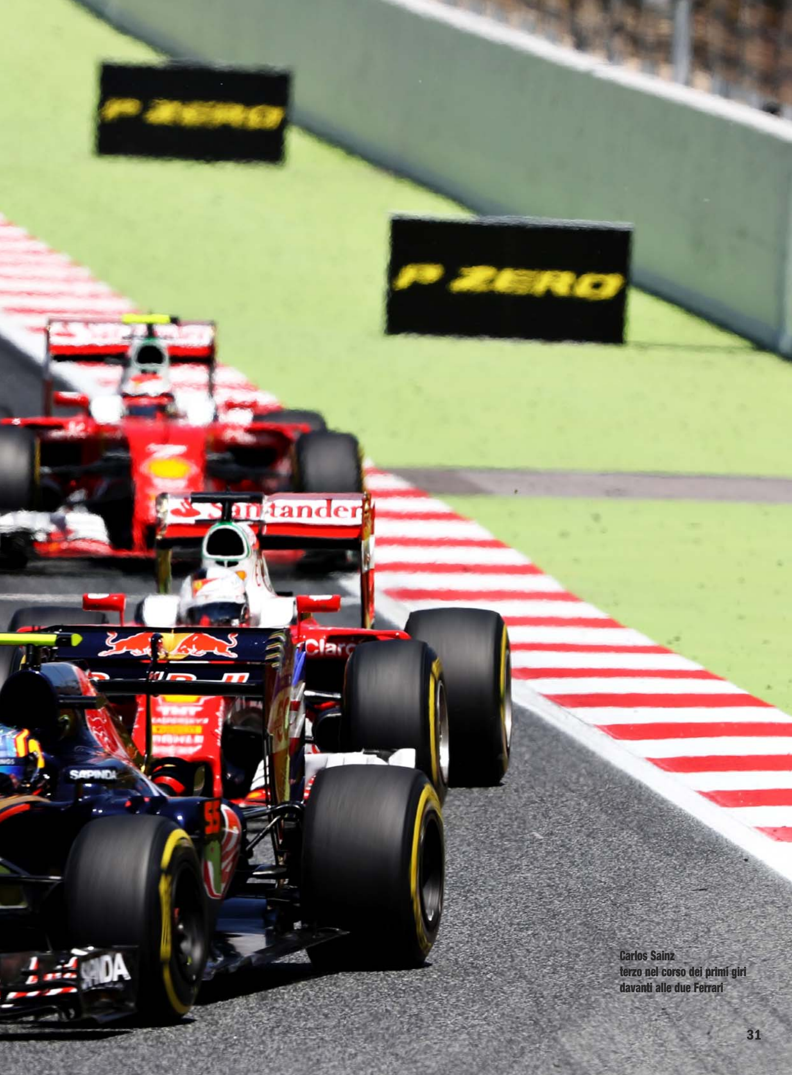
Carlos Sainz terzo nel corso dei primi giri davanti alle due Ferrari