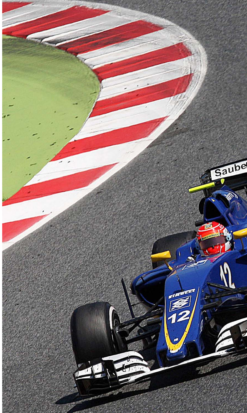
Continua il calvario della Sauber

D'accordo l'altro avrà pur chiuso, ma non ci è parsa la maniera migliore per tentare un sorpasso. Una manovra disperata da ultimo giro piuttosto che una staccata alla terza curva del 1° giro di un GP tutto da disputarsi. Spento il cervello.