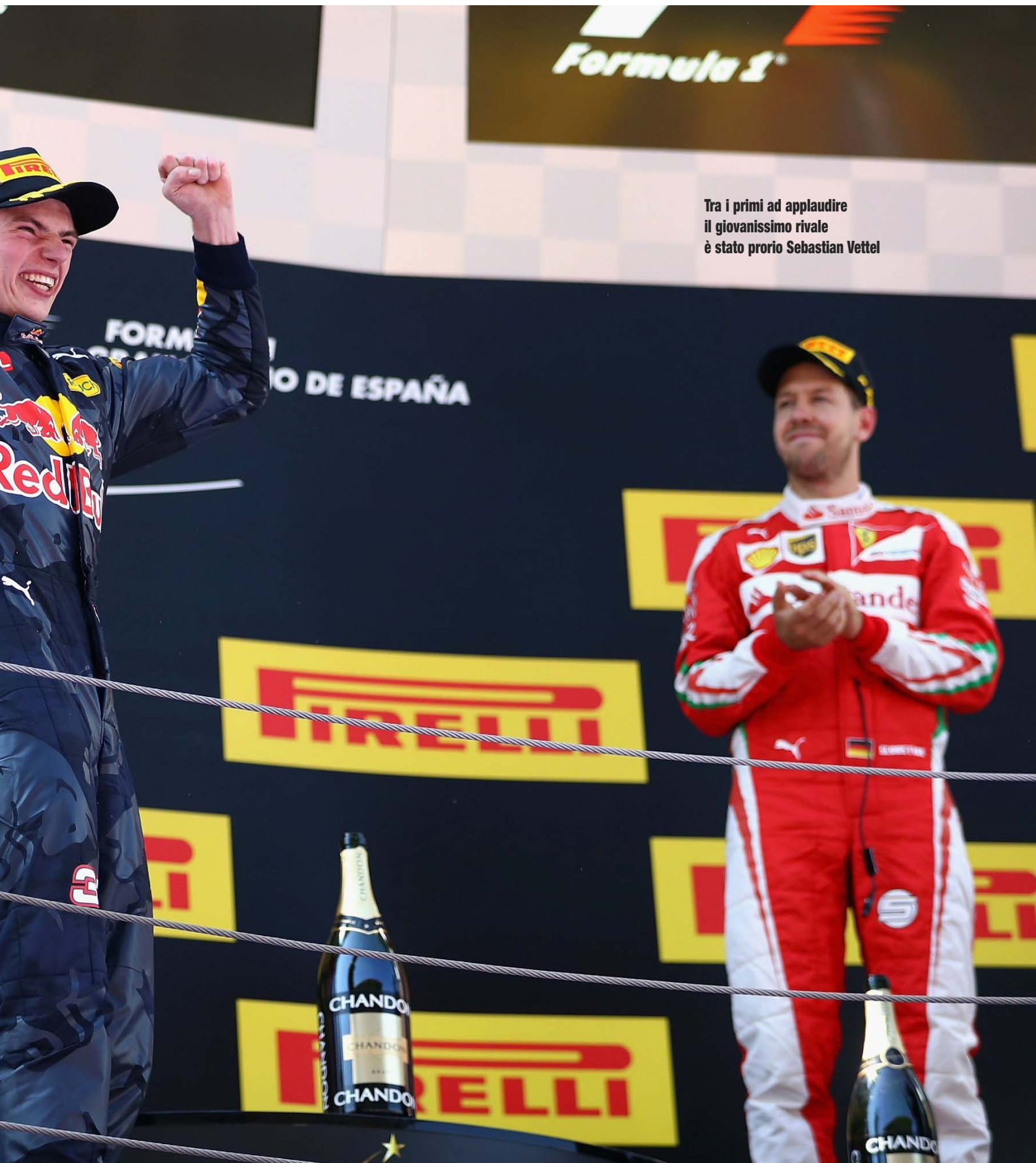
Tra i primi ad applaudire il giovanissimo rivale è stato proprio Sebastian Vettel