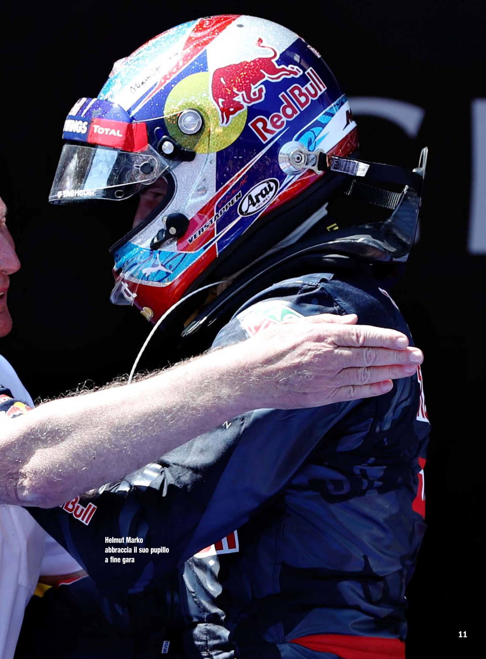
Helmut Marko abbraccia il suo pupillo a fine gara