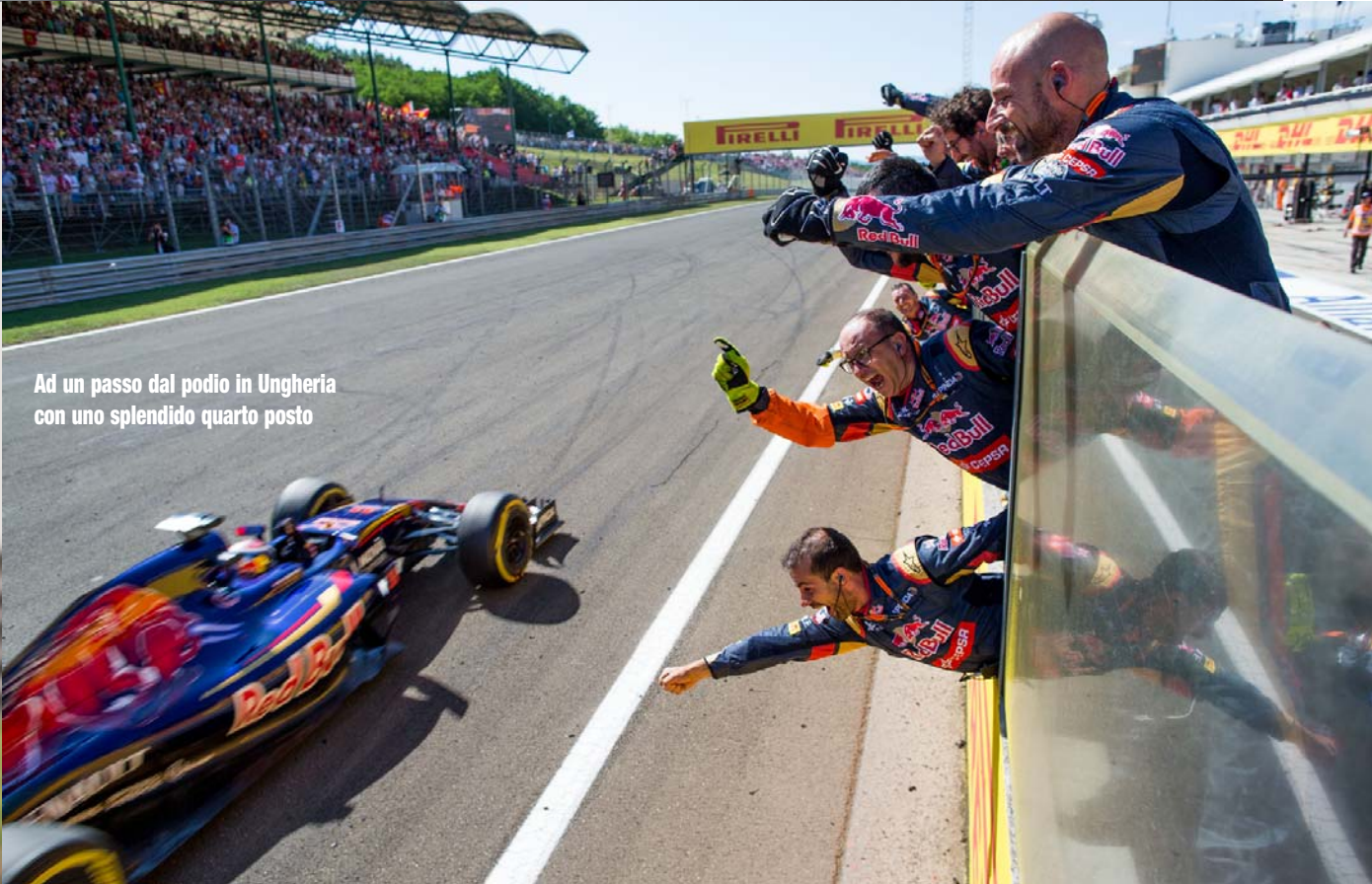
Ad un passo dal podio in Ungheria con uno splendido quarto posto