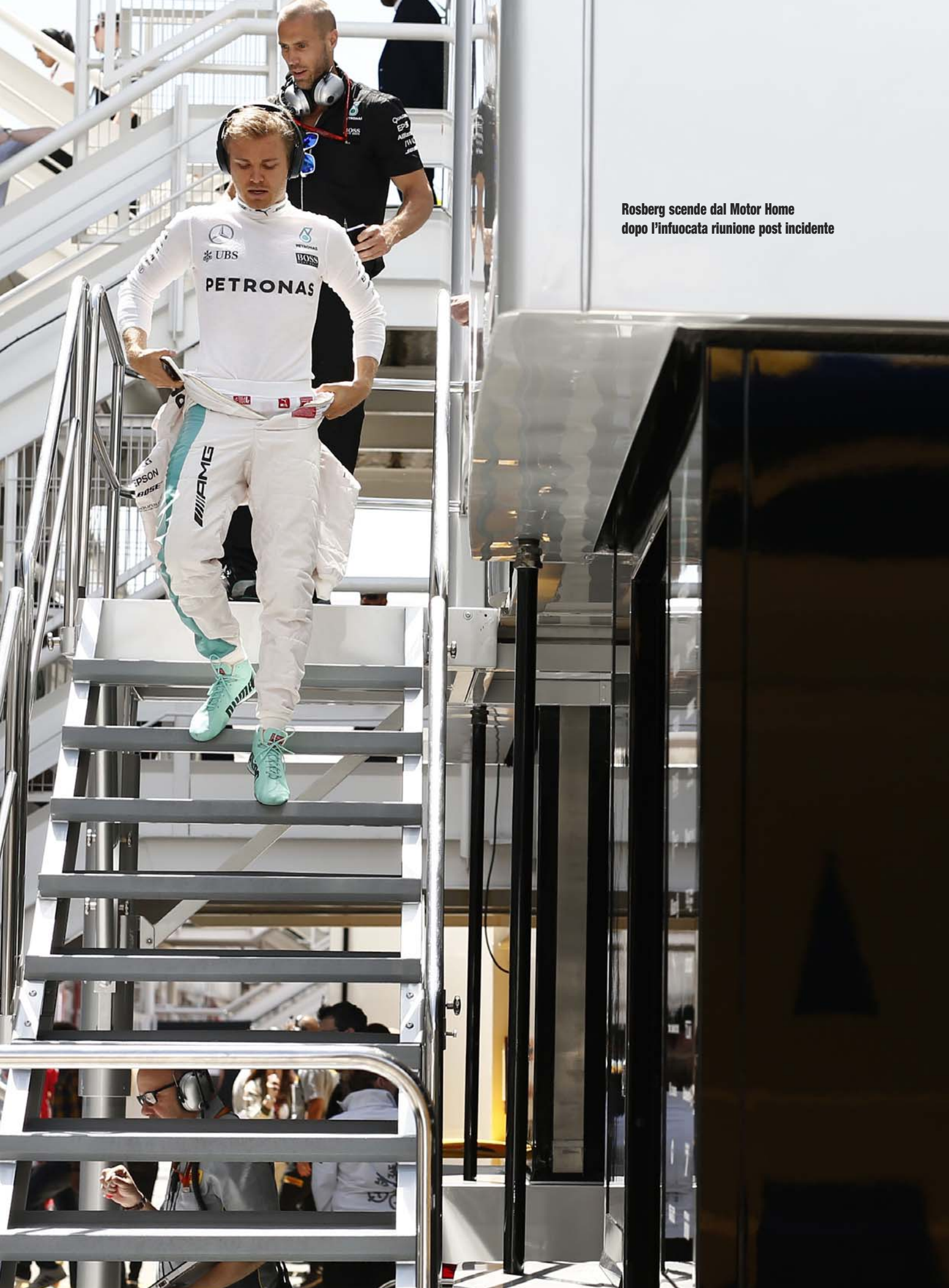
Rosberg scende dal Motor Home dopo l'infuocata riunione post incidente