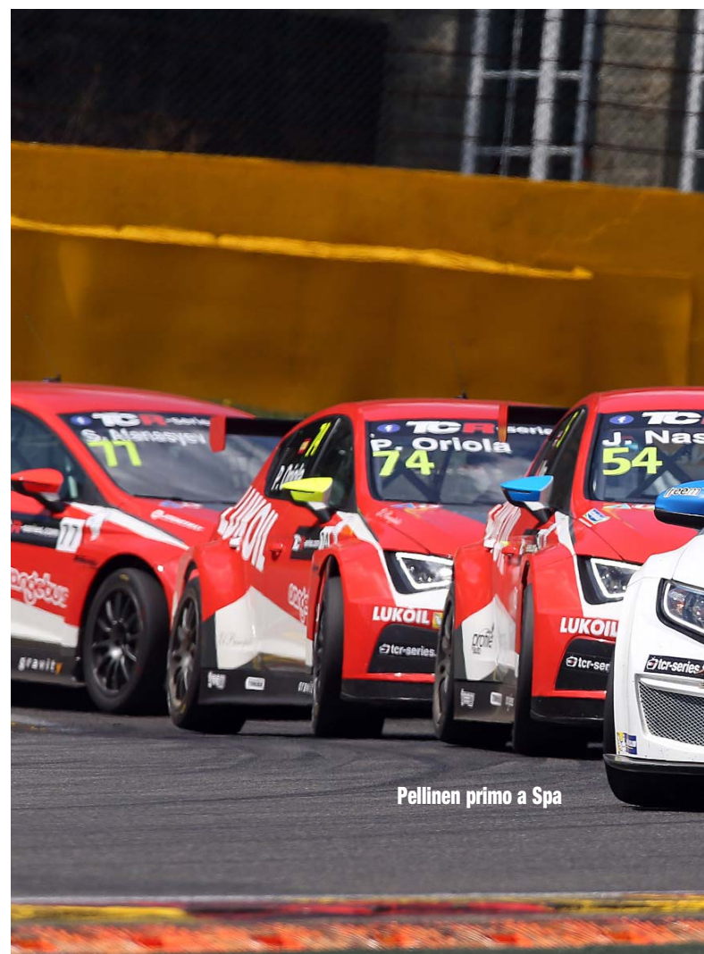
Pellinen primo a Spa