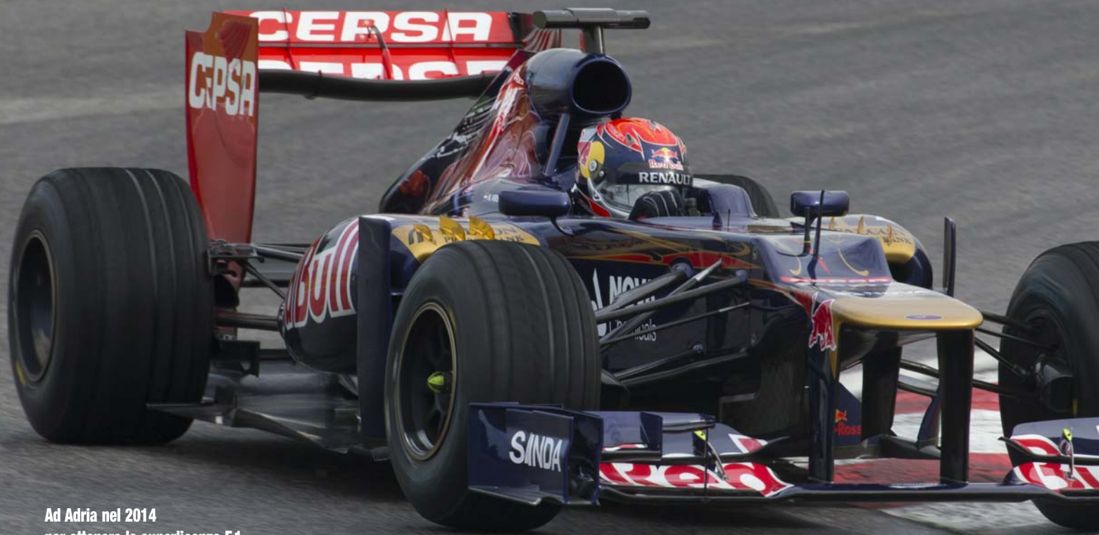
Ad Adria nel 2014 per ottenere la superlicenza F.1

In posa con gli altri boys del pianeta Red Bull: Carlos Sainz Jr, Daniil Kvyat e Daniel Ricciardo