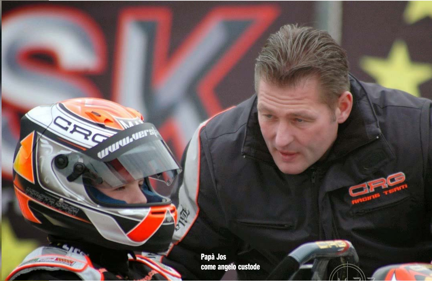
Papà Jos come angelo custode