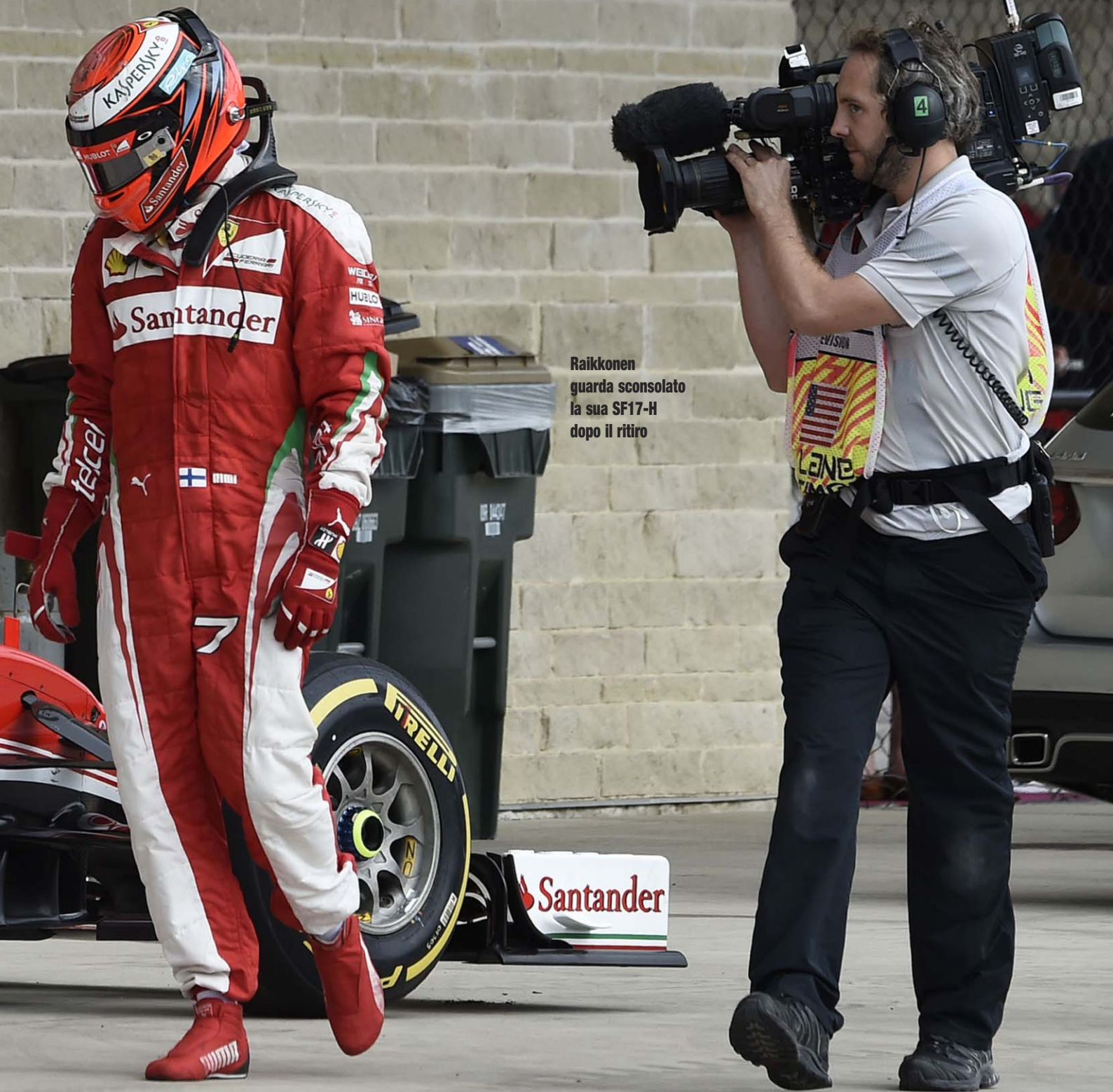
Raikkonen guarda sconsolato la sua SF17-H dopo il ritiro

di 53 punti sarebbe stato anche più pesante. «In questa stagione abbiamo avuto momenti buoni e momenti cattivi», filosofeggia Vettel. «Le corse sono così, l'importante è non distrarsi da quello che conta davvero adesso, cioè il lavoro che viene fatto in fabbrica». Preoccupa di più, anche in prospettiva 2017, sentirli dire che «è da inizio stagione che abbiamo constatato che la nostra vettura in certe condizioni non si comporta come vorremmo. E' qualcosa su cui abbiamo lavorato, facendo dei progressi, ma c'è ancora molto da fare». L'impressione è che lo pensi anche Mar- chionne, mentre impugna una penna con davanti una lista di nomi da cancellare.