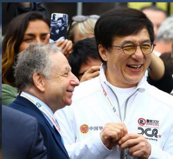
Jackie Chan con Jean Todt a Le Mans

Jackie Chan ha conquistato con il suo team uno spettacolare doppio podio assoluto a Le Mans. Scopriamo di più l'avventura nel mondo dell'endurance e dell'attore, stuntman e regista di Hong Kong