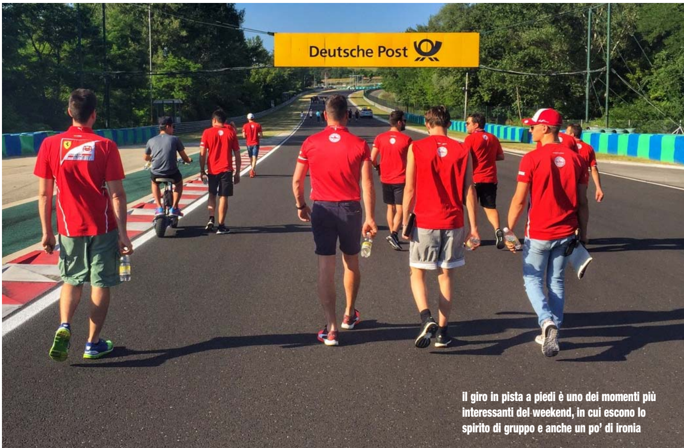
Il giro in pista a piedi è uno dei momenti più interessanti del weekend, in cui escono lo spirito di gruppo e anche un po' di ironia